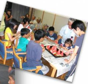
スイカを食べに 近所の子供たちが 遊びに来てくれました