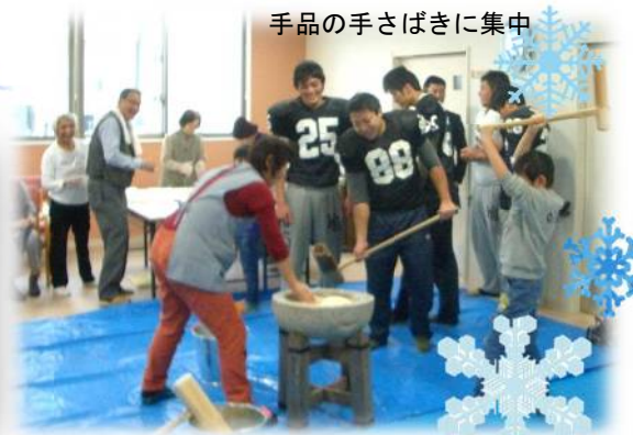
餅つき大会 (イメージ)