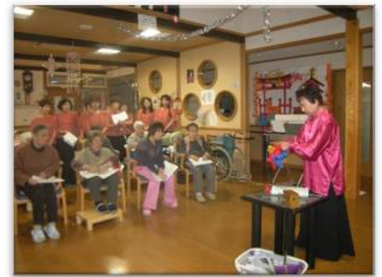
ボランティアさんの