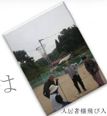
入居者様飛び入り参加