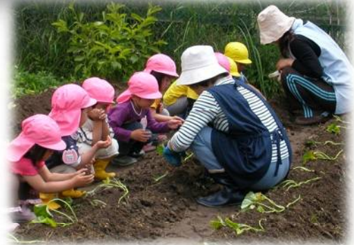
保育園児との交流 サツマイモの苗植え