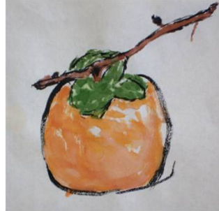
入居者様の作品です